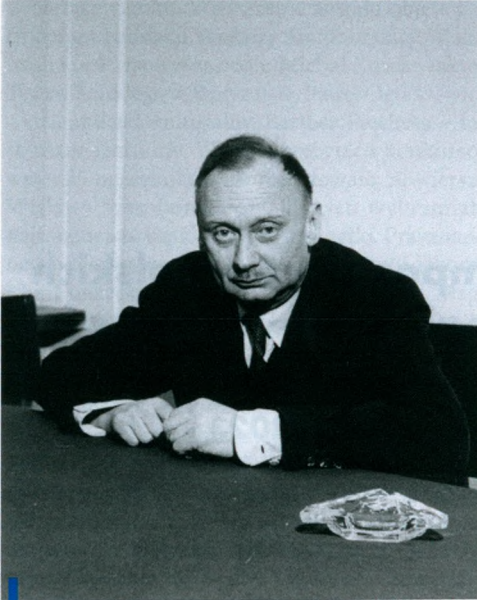
Stefan Kisielewski – kompozytor, literat, działacz polityczny

madzeniu, gdzie podano: Do pracy przy Prezydium w zakresie spraw biblioteki wciągnięto członka kandydata J. Krenza i zlecono mu dysponowanie przeznaczoną na zakup książek i płyt sumą złotych 450 000,- (rocznie). Zakupiono dotychczas wyciąg fortepianowy Harnasi K. Szymanowskiego i kilka drobniejszych utworów klasycznych 6 . Natomiast dalej czytamy, iż zakupiono szafę, uporządkowano bibliotekę, sporządzono inwentarz, wciągnięto doń wydane w okresie sprawozdawczym dzieła muzyczne 7 . A zatem zbiory rozwijano z rozmysłem i odpowiedzialnie, tym bardziej, że podano również, że: ZKP otrzymało od Syndykatu Kompozytorów Czeskich bibliotekę czeskich utworów muzycznych (ok. 1000 [sic!] egzemplarzy), z czego do biblioteki Zarządu Głównego przyjęto 55 utworów, resztę pozostawiając w siedzibie ZKP w Krakowie, dokąd biblioteka nadeszła 8 . Podsumowując, nasza placówka niewątpliwie już istniała i funkcjonowała w 1948 r. jako zorganizowany i zinwentaryzowany zbiór książek i nut pochodzących zarówno z darów, jak i zakupów wydawnictw nowych oraz dawniejszych.