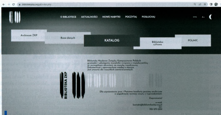
Strona bibliotekazkp.org.pl projekt: Anna Grygowska, wykonanie: Jadwiga Irena Zymer

ny w ten sposób, nasz stary, stacjonarny system biblioteczny powstał około 2000 r. i rozwijaliśmy go przez niemal 15 lat, aż stał się – tak samo jak nasza baza – mocno archaiczny i ogromnie kosztowny – nie tyle wprost w sensie finansowym, ile w związku z tym, że wprowadzanie danych było bardzo czasochłonne. Po pewnym czasie zaczęliśmy stopniowo rezygnować z tworzenia rozbudowanych opisów, upraszczając je do granic, by w końcu zaobserwować, że przyrost zbiorów jest szybszy niż katalogowanie. Ponadto, coraz bardziej dyskwalifikującymi cechami stawały się stacjonarność (niemożność pracy w internecie) i jednostronność. To pchnęło nas w kierunku szukania nowego systemu. Wybór padł na system KOHA, który jest bezpłatny, a przy tym otwarty, czyli pełną administrację możemy mieć po swojej stronie. Katalog jest nadal w budowie, co znaczy, że po zakończonym sukcesem imporcie danych ze starego katalogu nadal opracowujemy te pozycje, które nigdy w starym, stacjonarnym katalogu nie figurowały, a także zbiory całkiem nowe.