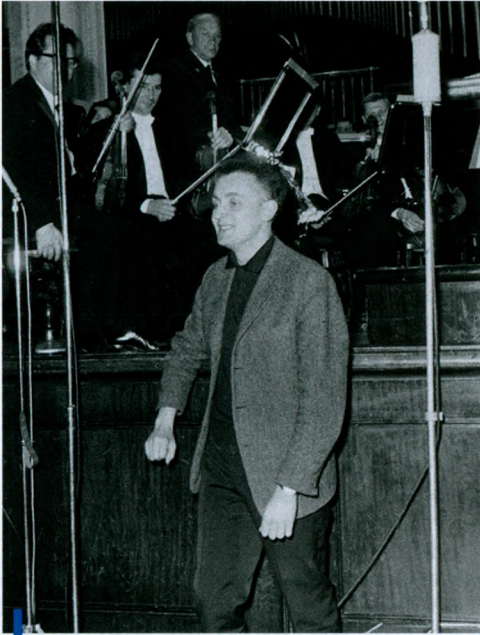
Młodzieńki Wojciech Kilar, kompozytor

użytkowników bez konieczności logowania i podawania danych. W przypadkach, gdy prezentowany może być jedynie fragment, czytelnicy mają do dyspozycji narzędzie „Poprosz o dostęp”, gdzie w zwięzłym formularzu podają swoje dane oraz powód, dla którego chcą uzyskać dostęp do dzieła. W odpowiedzi (z bardzo nielicznymi wyjątkami) otrzymują link do całości.